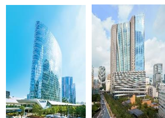
▲（左）品川インターシティ （右）赤坂インターシティ AIR